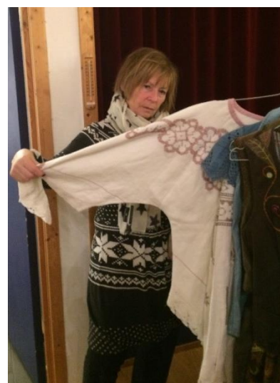
En duk er sydd om til bluse.