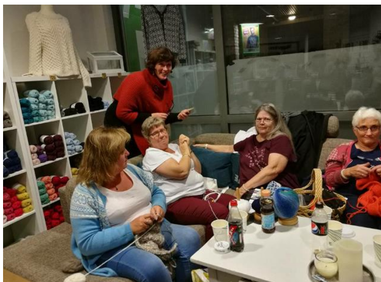
Fra håndarbeidskafé på Nøstefryd.

Ta med deg et håndarbeidet til sosialt samvær. Håndarbeidskafé og Åpent Hus er et sosialt tilbud til både medlemmer og ikke medlemmer. Vi koser oss med kaffe og håndarbeid. Ta gjerne med deg en venn/venninne og møt opp.